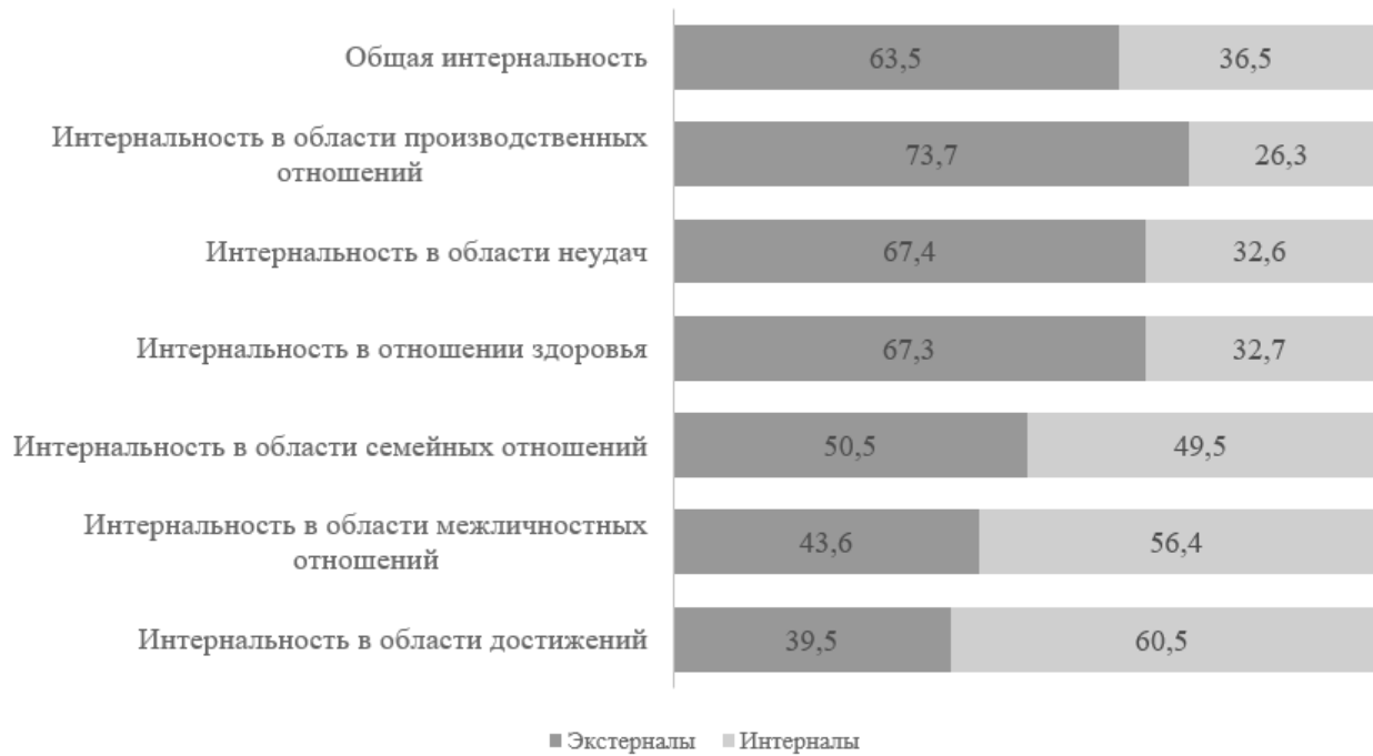
Рис. 2. Уровень субъективного контроля педагогов по шкалам методики УСК, в %