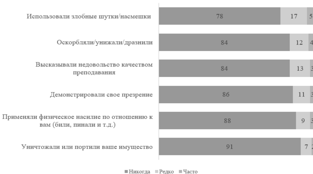
Рис. 1. Опыт столкновения педагогов с прямой агрессией со стороны учащихся, в %