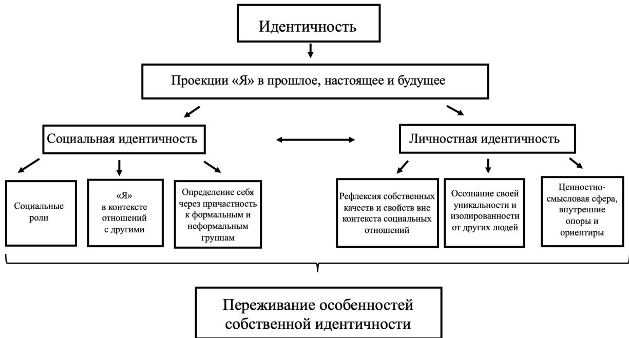
Рис. Теоретическая модель исследования

преодолеть данное состояние, овладев новыми паттернами поведения и категориями самоопределения. Одним из переломных и значимых кризисов социальной идентичности считается кризис, приходящийся на период ранней взрослости, что и послужило отправной точкой для нашего дальнейшего исследования.