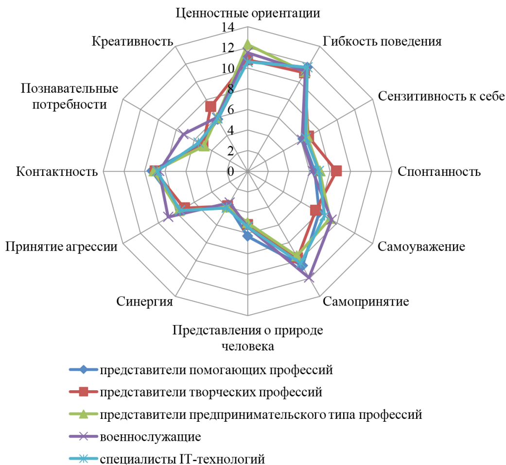
Рис. 2. Выраженность самоактуализационного профиля у представителей разных типов профессий

Представители профессий предпринимательского типа отличаются более высокими показателями по шкале «Поддержка». Они независимы в своих поступках, стремятся руководствоваться в жизни собственными целями, убеждениями, установками и принципами, свободны в выборе, не подвержены внешнему влиянию, т. е. являются «изнутри направляемыми» личностями. Они разделяют ценности самоактуализации и стремятся к ней как к возможности проявить себя в полной мере.